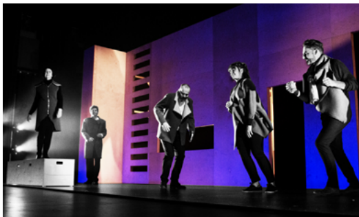
L'Usine de théâtre potentiel