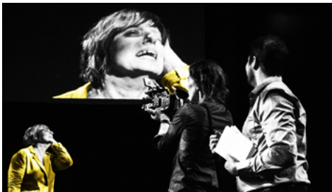
La LNI s'attaque au cinéma