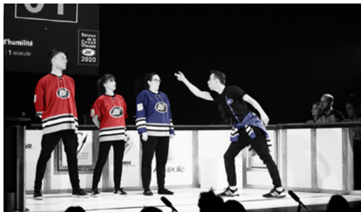
Match de la Ligue Nationale d'Improvisation Saison de la Coupe Charade de la LNI © Théâtre de la LNI, 2020 PHOTOGRAPHE Catherine Asselin-Boulangier INFOGRAPHIE Pascale GD