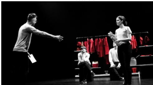
La LNI s'attaque aux classiques