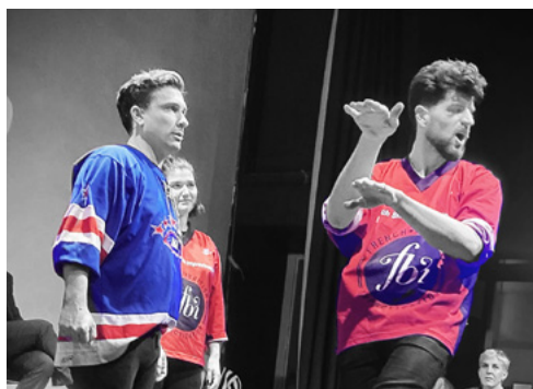
LONDRES Tournée européenne 2022

En 1982, lors d'un passage remarqué au Festival d'Avignon, la LNI présentait le Match d'impro à l'Europe et au reste du monde. Depuis, le Théâtre de la Ligue Nationale d'Improvisation traverse régulièrement l'océan. L'organisation de tournées officielles permet notamment d'enrichissants échanges avec des acteur·rices de l'improvisation au-delà de nos frontières, nous offrant l'occasion de nourrir notre pratique tout en mettant la lumière sur les véritables pionniers de la discipline que nous sommes.