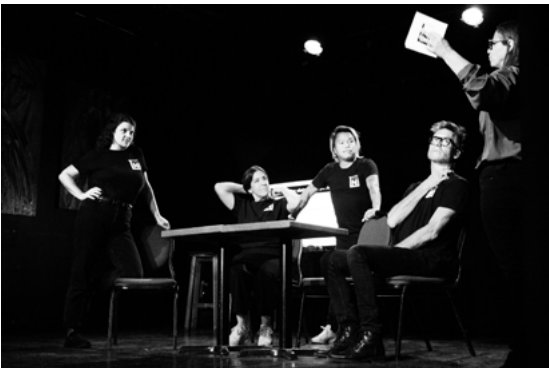
Les Laboratoires LNI, 2022