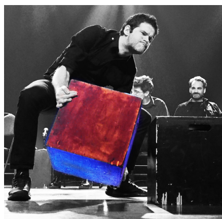
LES ARCHITECTES, à la Salle Jean-Paul-Tardif, 2019