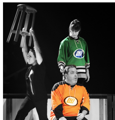
IMPRO MONTRÉAL, Wolves - a duo show , 2017