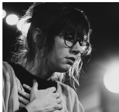
Tournoi de la LIRTA (LIGUE D'IMPROVISATION RENCONTRE THÉÂTRE ADOS), au Collège Letendre de Laval, novembre 2019